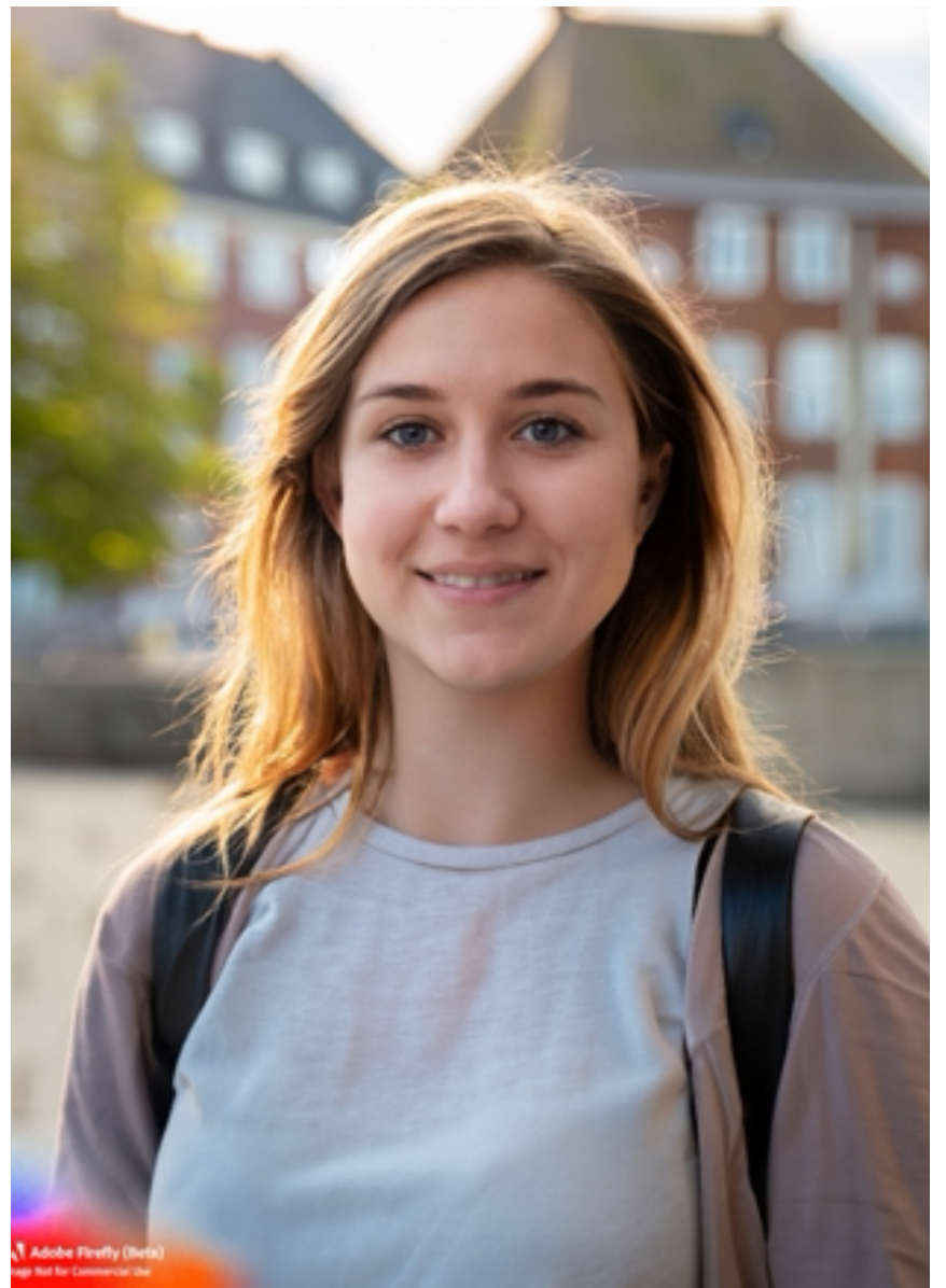
Det kan være svært at gennemskue et falsk billede. Pigen på billedet findes slet ikke i virkeligheden, men ligner en vi kunne møde på gaden. Billedet er lavet i Adobe Firefly.

Malinformation: Er hverken sand eller falsk, men udtryk for en holdning og kan f.eks. være hadtale mod en bestemt gruppe.